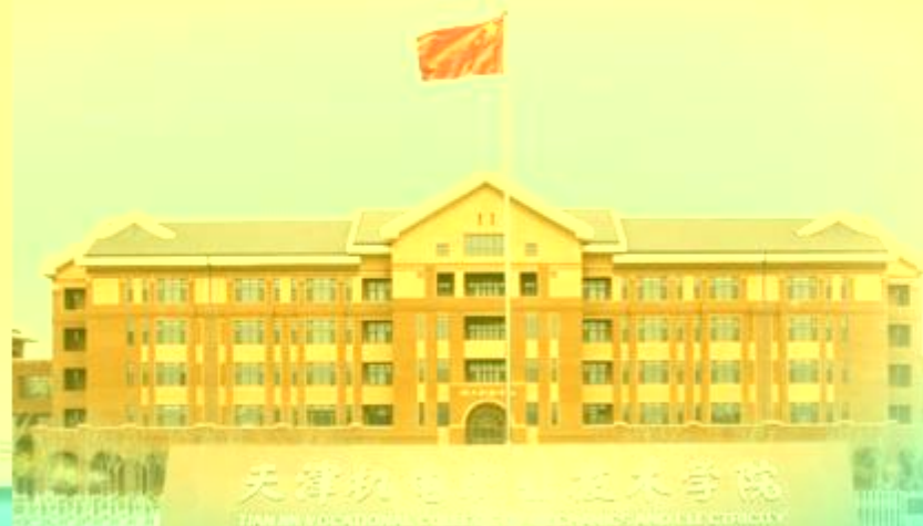
天津机电职业技术学院 TIANJIN VOCATIONAL COLLEGE OF MECHANICAL, ELECTRICAL AND ELECTRONIC TECHNOLOGY